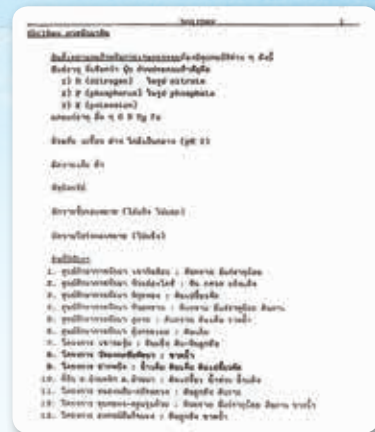
โทรสารพระราชทานเรื่องดิน

ตัวอย่าง โครงการศูนย์ศึกษาการพัฒนาอันเนื่องมาจากพระราชดำริ ทั้ง ๖ แห่ง ทั่วประเทศ ระยะแรกจะทรงเตรียมพระองค์ด้านข้อมูลและความรู้ที่จะทรงนำไปประยุกต์ใช้ในการแก้ปัญหา โดยมีขั้นตอนในการดำเนินงานตั้งแต่การศึกษาข้อมูลพื้นฐาน เช่น สภาพภูมิประเทศ สภาพภูมิอากาศ แหล่งน้ำและการประกอบอาชีพก่อน จึงพระราชทานพระราชดำริ ซึ่งการพัฒนาอันเนื่องมาต้นต้องเป็นไปตามลำดับขั้นตอน ความจำเป็นและประหยัด ผู้ได้รับประโยชน์ คือ ประชาชนที่สามารถพึ่งตนเองได้ในที่สุด ควบคู่ไปกับการอนุรักษ์และพัฒนาทรัพยากรธรรมชาติ